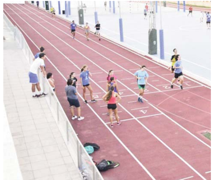
Pistas de atletismo en Tomares.

Pero el compromiso del consistorio no se detiene ahí.