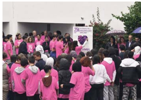
Reunión de tomareños en el patio del Ayuntamiento.

NUEVAS HERRAMIENTAS Se ha puesto en marcha una Comisión Local contra la Violencia de Género