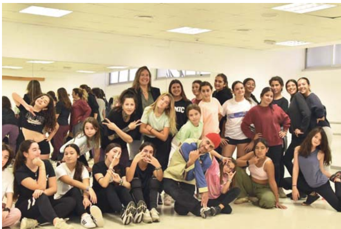
Imagen de la Masterclass de Bboy ShagizoO.

Durante la masterclass, las jóvenes participantes, conocidas como B-Girls en el mundo del breaking, tuvieron la oportunidad de aprender las técnicas de este baile olímpico