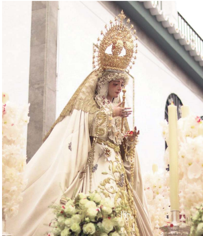
La Virgen de los Dolores durante su salida extraordinaria del pasado mes de septiembre. HDAD SACRAMENTAL

Además, la Hermandad se ha hecho presente en momentos simbólicos durante todo el año, como la celebración del altar del Corpus Christi de Sevilla y la colaboración en los actos de la Hermandad del Rocío, llevando sus colores en las columnas. La Hermandad vivió un emotivo 8 de junio con la salida extraordinaria del Stmo. Cristo de la Vera Cruz, que reunió a cientos de devotos, y la participación de dos bandas de renombre: la Banda de la