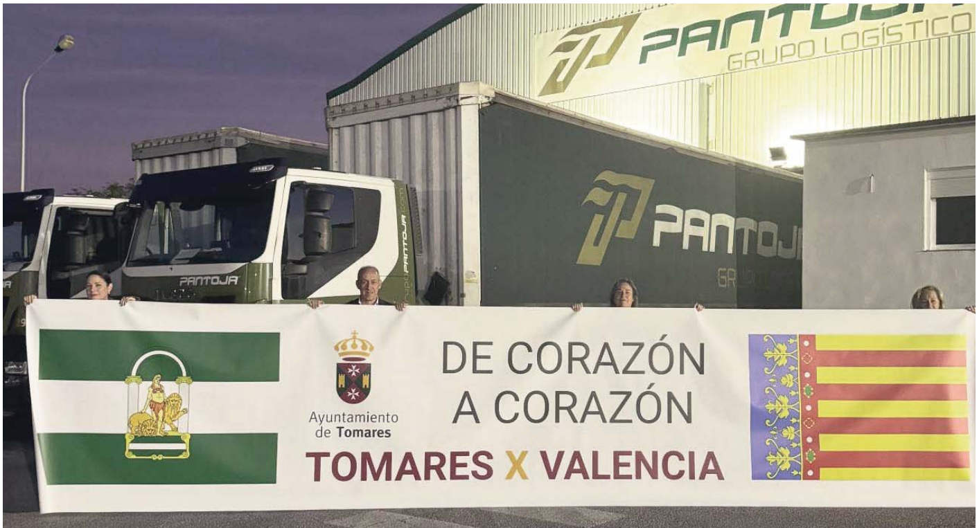
Tomares envía dos camiones a Valencia cargados de ayuda humanitaria. AYUNTAMIENTO DE TOMARES