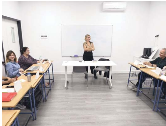
Talles de Escritura Creativa en Tomares. AYUNTAMIENTO DE TOMARES

El taller, impartido por la escritora, crítica literaria y