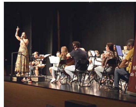
Banda Sinfónica de Tomares. AYUNTAMIENTO DE TOMARES

La programación continuó los sábados siguientes con teatro infantil. El día 23 se presentó "Animalitos", y el 30 de noviembre la obra "Blowing". Las entradas para estas actividades estuvieron disponibles tanto en taquilla como online, con precios reducidos para empadronados y entrada gratuita para menores de cinco años.