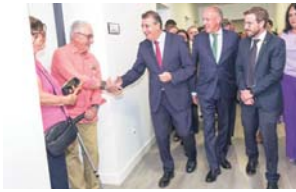
La rehabilitación del antiguo colegio Tomás de Ybarra es uno de los proyectos que destaca el alcalde durante su mandato.

ce 12 años, en plena crisis económica. No solo ha dado a conocer nuestra oferta gastronómica, sino que ha mejorado mucho el nivel de nuestra gastronomía local. Me alegra mucho que con el paso de los años se sigan llevando a cabo. Es una de las más consolidadas en la provincia de Sevilla, y los vecinos la esperan con entusiasmo cada noviembre.