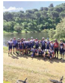
Club Ciclista de Tomares. CCT