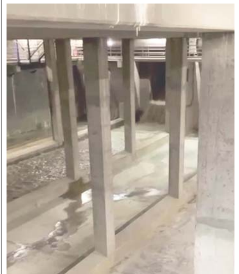
Imagen del Tanque de Tormentas de Tomares.