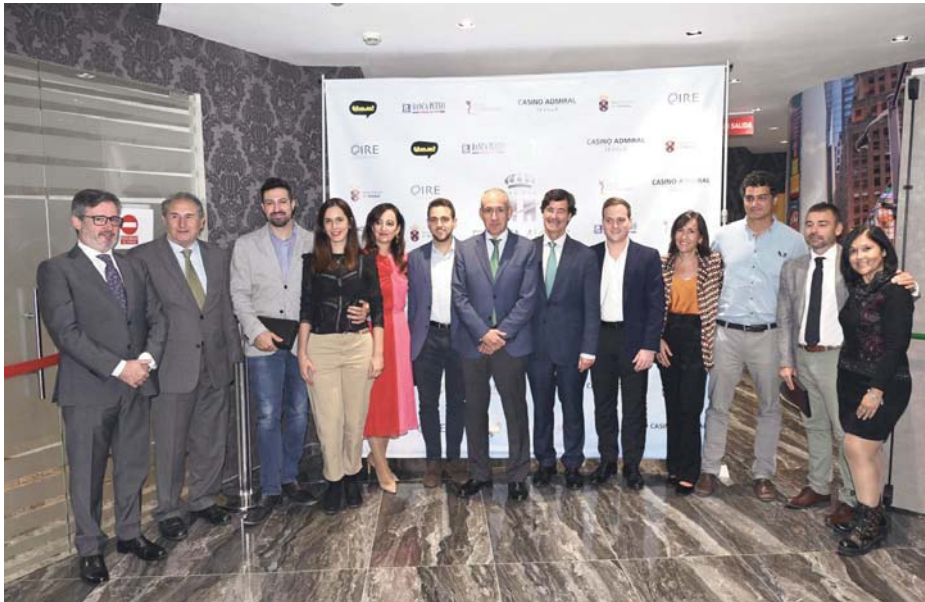
Foto de familia de los Premios a la Excelencia Empresarial "Ciudad de Tomares" 2024.