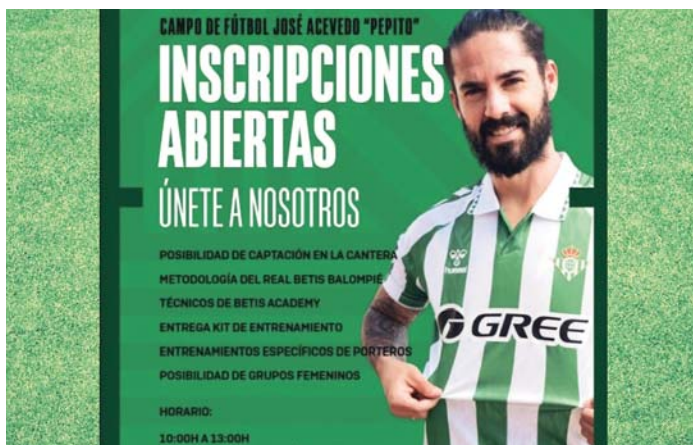
Cartel del campus. REAL BETIS

FÚTBOL Esta actividad se celebrará del 14 al 16 de abril