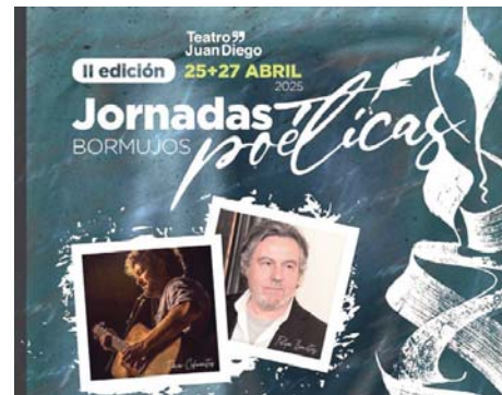
Jornadas poéticas de Bormujos. AYO DE BORMUJOS

Con esta iniciativa, Bormujos reafirma su compromiso con la cultura y la literatura, ofreciendo un espacio para que la poesía cobre vida sobre el escenario.