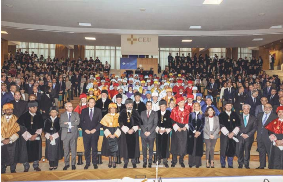
Foto de familia del Acto de Investidura.

se ha querido reconocer “su labor para acercar el mundo de la empresa a la universidad, así como su compromiso social” y de Manuel Marchena se ha destacado “su actuación ejemplar en la preservación del Estado democrático de Derecho y de sus institu-