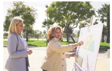
Proyecto del nuevo parque "La Alquería". AYTO BORMUJOS

y praderas, la renovación de las pistas deportivas, la reposición del mobiliario urbano y la sustitución de la iluminación para modernizar el parque. Además, se incluirán nuevos aseos para mejorar la comodidad de los usuarios. Con estas actuaciones, el Parque "La Alquería" se convertirá en un espacio verde urbano de referencia en el Aljarafe, ofreciendo un lugar de recreo y disfrute para todos los públicos.