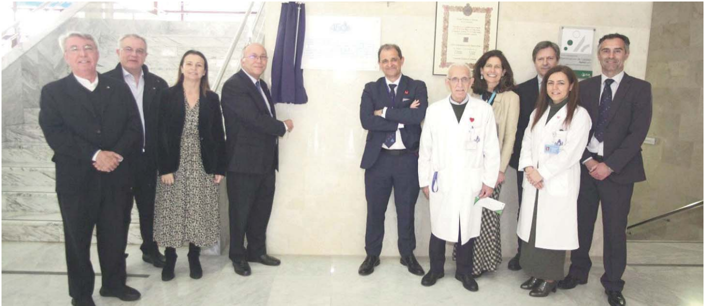
El Hospital San Juan de Dios del Aljarafe se reúne con las asociaciones.