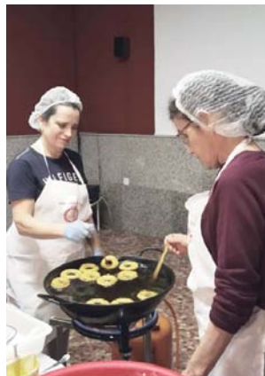
Durante la cuaresma, un grupo de mujeres se reúne para elaborar dulces tradicionales como pestiños, roscos, empanadillas, entre otros.