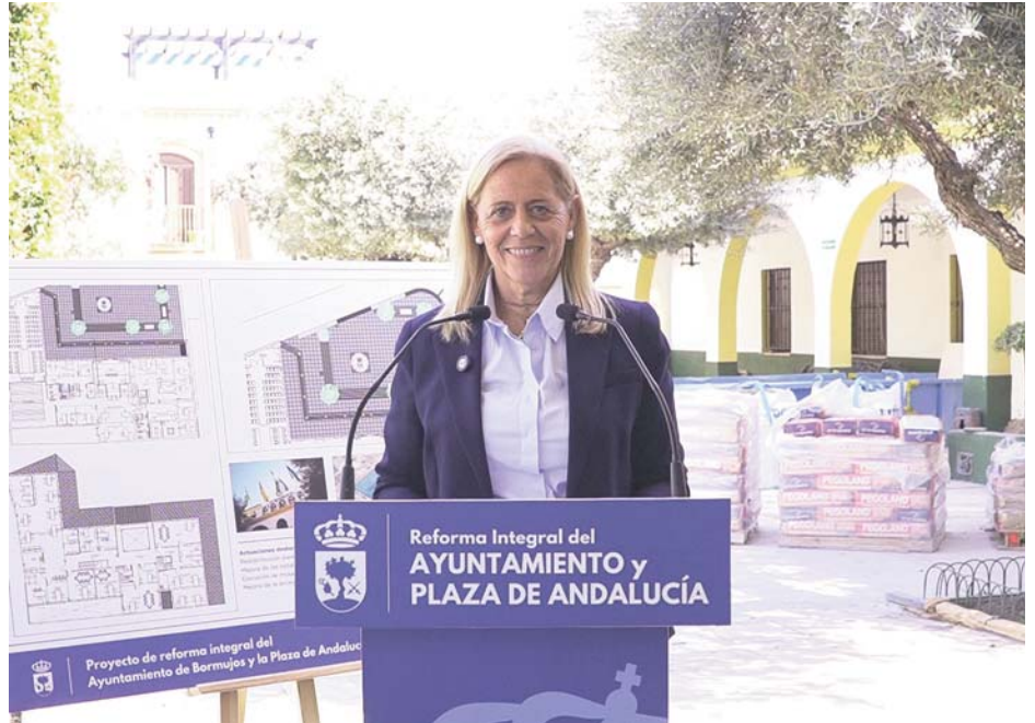
La alcaldesa de Bormujos, Lola Romero, presenta el proyecto de reforma integral del Ayuntamiento y la Plaza de Andalucía.

"Serán más de 310.000 euros de inversión, que devolverán a los bormujeros un espacio y un ayuntamiento mucho más accesible, amable y cercano", ha concluido Lola Romero.