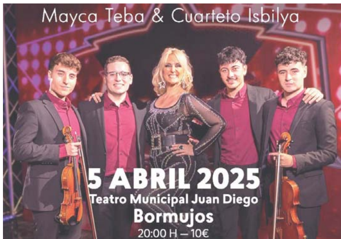
Cartel de Mucho más que Ópera. AYUNTAMIENTO DE BORMUJOS

El espectáculo se estrenó en el Centro de Bellas Artes de San Juan de Puerto Rico con la Orquesta Sinfónica Arturo Somohano bajo la dirección del maestro Roselín Pabón y con el apoyo del Consulado Español. Posteriormente, se reestrenó en España con la Orquesta Sinfónica Odón Alonso en el Auditorio Ciu-