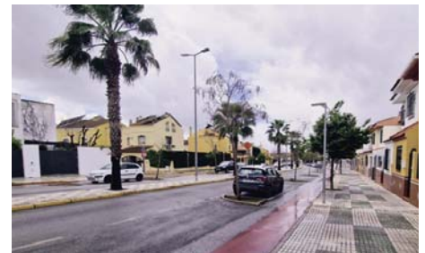
Avenida Juan Diego. AYO DE BORMUJOS

Este proyecto forma parte del Plan Municipal de Inversiones, una estrategia para mejorar la infraestructura urbana y la calidad de vida de los ciudadanos.