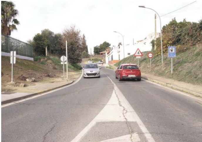
La carretera A-8063.