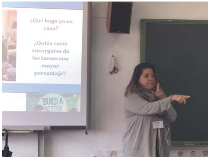
“Corresponsable, ¡Todos y todas a una!”. AYUNTAMIENTO DE BORMUJOS

mentales de esta actividad es que no se limita únicamente a la enseñanza teórica, sino que incentiva a los participantes a reflexionar sobre la manera en que pueden aplicar estos conocimientos en su vida diaria. En la última sesión del taller, se abrirá un espacio de debate en el que los estudiantes compartirán sus impresiones y analizarán cómo pueden trasladar lo