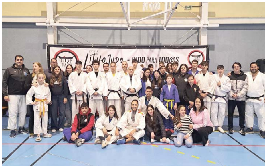
Foto de familia del torneo Litho Judo.