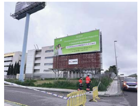
Calle cortada en Bormujos. AYTO BORMUJOS

Tanto la Policía Local como el Servicio de Protección Civil agradecieron la colaboración de los vecinos e insistieron en la importancia de mantenerse informados ante posibles incidencias relacionadas con el temporal.