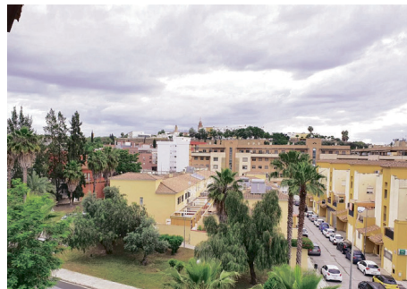
San Juan de Aznalfarache. AYUNTAMIENTO DE SAN JUAN

total de 347.740 euros. De esta cantidad, la Consejería de Empleo, Empresa y Trabajo Autónomo de la Junta de Andalucía aporta 231.000 euros, mientras que el Ayuntamiento contribuye con el resto, 116.740 euros. Esta iniciativa se enmarca dentro del programa de políticas activas de empleo financiado por las transferencias finalistas del Estado, según el presupuesto aprobado para el pasado año 2024.