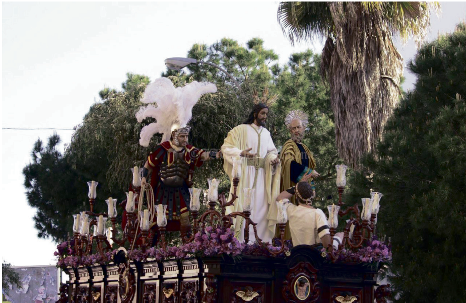
Hermandad de Los Ángeles de San Juan de Aznalfarache.

Uno de los aspectos más comentados este año es el pe-