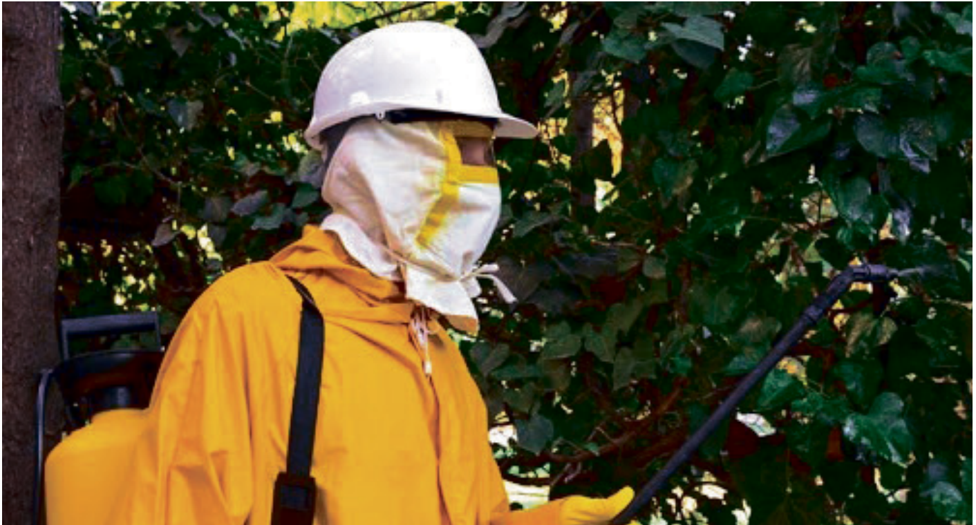
Un trabajador realiza una labor de fumigación.