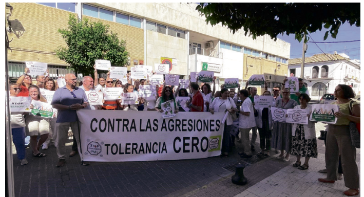
Concentración del Sindicato Médico.

AGRESIÓN Los sanitarios recibieron insultos y amenazas por parte de un paciente que exigía un tratamiento no indicado