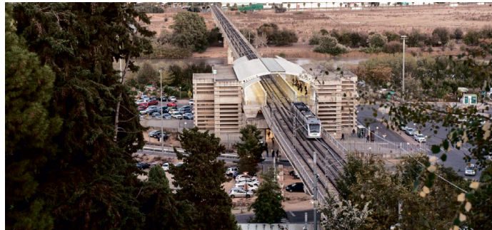
El metro a su paso por San Juan de Aznalfarache.

Ello, después de que la Junta de Andalucía reclamase más de 172 millones de euros a los cuatro municipios abarcados por la línea uno del metro, que son Sevilla, Dos Hermanas, Mairena y San Juan; por la deuda derivada de la explotación del suburbano hispalense, --gestionado por una sociedad encabezada por