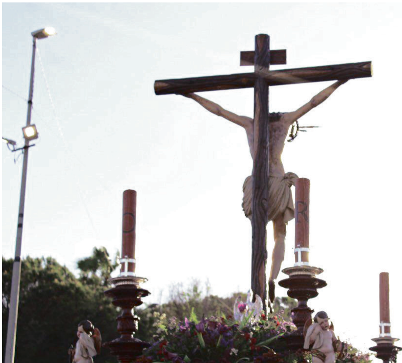
Hermandad Sacramental de San Juan Bautista de San Juan de Aznalfarache. HDAD SAN JUAN