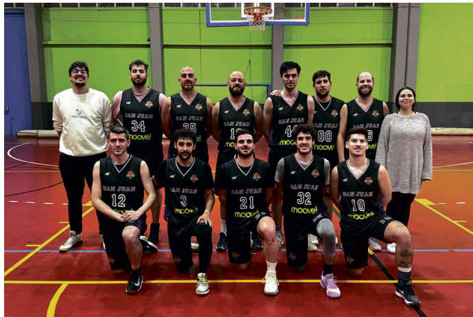
Equipo federado del CB San Juan. CB SAN JUAN

El CB San Juan mantiene su liderazgo en la competición, y con los cruces de octavos de final a la vista, el equipo se muestra preparado para afrontar lo que venga. Con una gran temporada a sus espaldas, la escuadra federada espera consolidar su primer puesto en la clasificación antes de dar el siguiente paso hacia los playoffs.