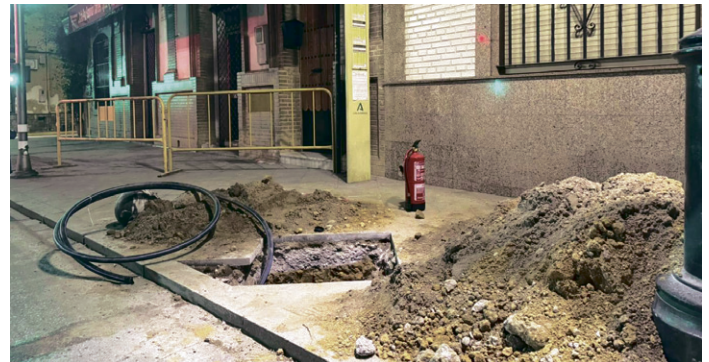
Obras en la Calle Real de San Juan de Aznalfarache.

Se trabajó en el control de la fuga de gas, logrando estabilizar la situación rápidamente. Según las autoridades, la incidencia no representó un peligro para la población, aunque se recomendó extremar la precaución en la zona afectada.