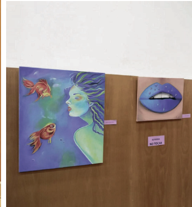
San Juan de Aznalfarache conmemora el Día Internacional de la Mujer con una serie de actividades culturales y educativas.