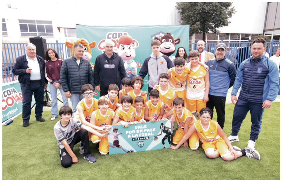
La Copa COVAP en San Juan de Aznalfarache. COPA COVAP