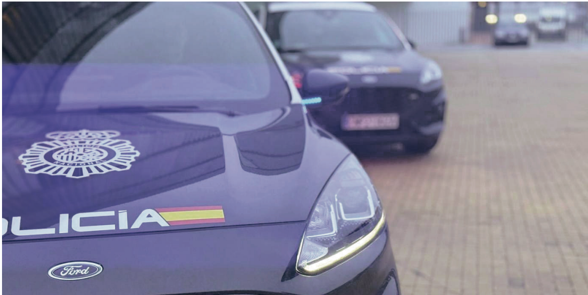
Policía Nacional. POLICÍA NACIONAL