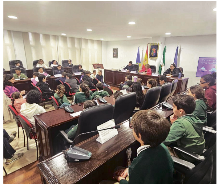
Pleno por la igualdad de San Juan de Aznalfarache.

El pleno comenzó con la lectura del artículo 14 de la Constitución Española, que proclama la igualdad de todos los ciudadanos sin distinción de sexo, raza o religión.