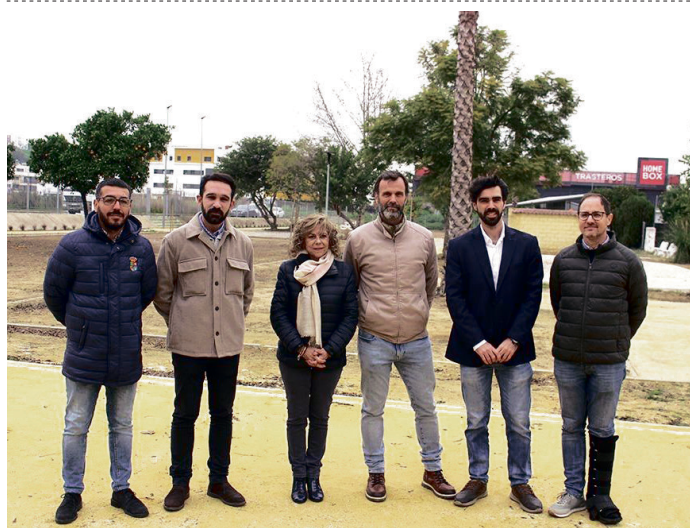
Visita al parque de la barriada de Valdovina. AYUNTAMIENTO DE SAN JUAN DE AZNALFARACHE