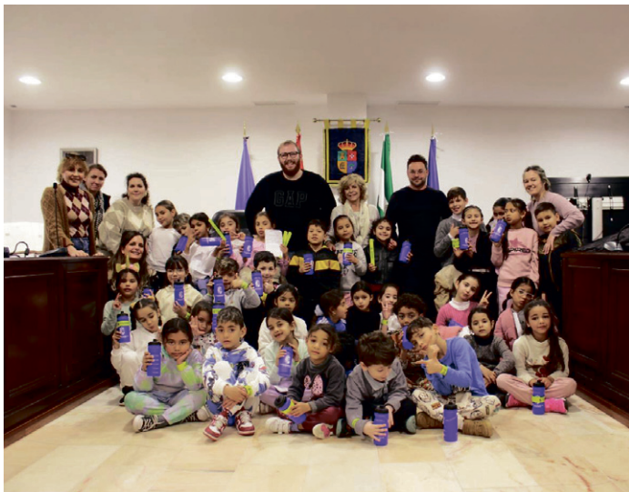
Escolares en el Salón de Plenos del Ayuntamiento de San Juan de Aznalfarache.

Durante la visita los niños y niñas han conocido algunos de los departamentos del Ayuntamiento y las funciones de las diferentes áreas municipales. La actividad consta de dos partes: una se desarrolla en el interior de la Casa Consistorial y la otra en la plaza de la Mujer Trabajadora donde se lleva a cabo una breve exhibición de los servicios de Medio Ambiente y Limpieza, Infraestructuras,