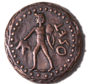
Moneda Ossetana. AYUNTAMIENTO DE SAN JUAN