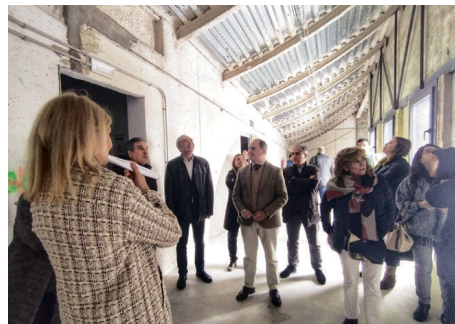
Visita a la oficina del SAE.