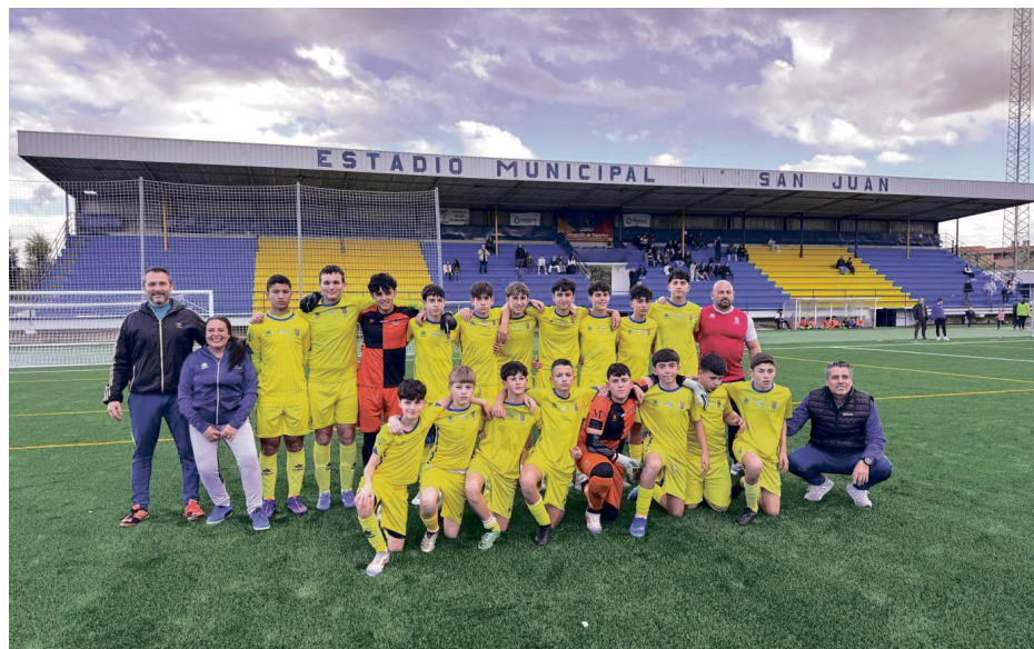
Primer partido del CMD San Juan con el nuevo césped.