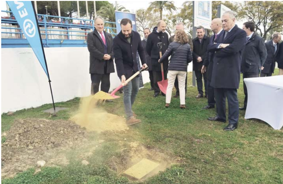
El alcalde de Camas, Víctor Ávila, durante la inauguración de la nueva planta de Emasesa.

La construcción de esta planta responde a la necesidad de reforzar la potabilización del agua en un contexto en el que las sequías son cada vez más frecuentes, más intensas y más prolongadas en el tiempo. "La última sequía ha sido una de las peores que se recuerdan, con una duración de seis años. No sabemos cuánto tardará en llegar la