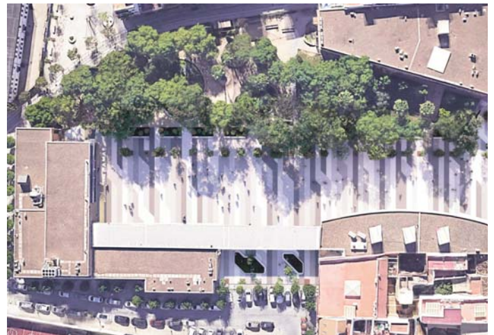
Imágenes del proyecto presentado por el Ayuntamiento de Camas.

viendo obligados a tomar rutas alternativas al no poder cruzar la plaza. Además, se han visto dificultados los accesos a los edificios públicos que se encuentran en este espacio. Ahora la entrada al Ayuntamiento se hace desde la calle Mariana de Pineda. Lo mismo sucede con la Biblioteca Pública Rafael Alberti. Por otro lado, para entrar al edificio Multifuncional hay que acercarse por la calle José Pa- yán.