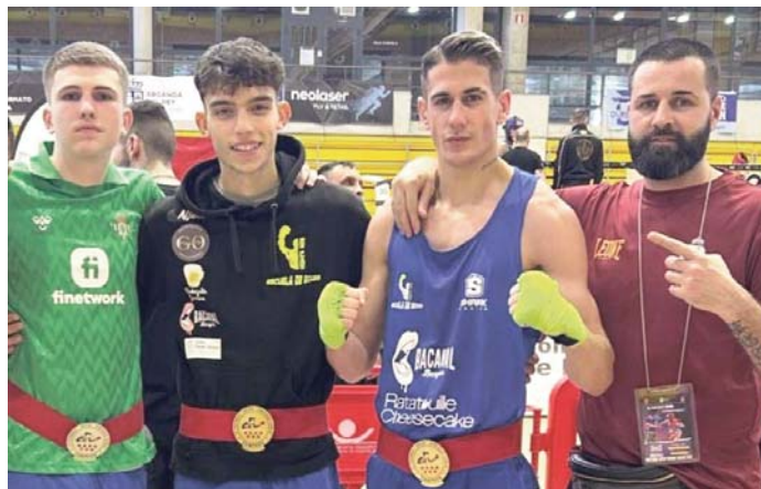
Boxeadores de la Escuela de Boxeo Seda Álvarez. VIVA

Seda atribuye este éxito a la pasión con la que se trabaja en su escuela de Camas. “El secreto es que esto no es un negocio, es pura pasión. A mis chavales no les falta de