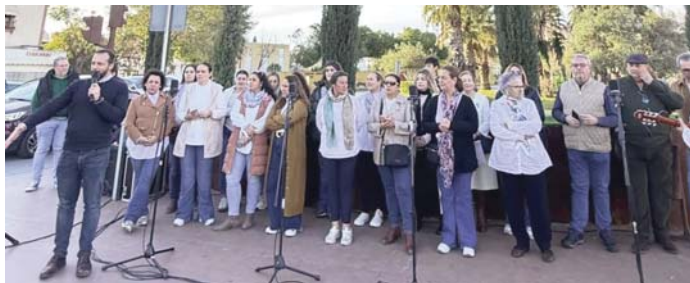
Acto del Día de Andalucía en Camas.

Con esta celebración, Camas se unió al resto de Andalucía para rendir homenaje a la identidad y los valores de la región, destacando el orgullo de ser andaluces y reafirmando el compromiso con las tradiciones y el patrimonio cultural de la comunidad.