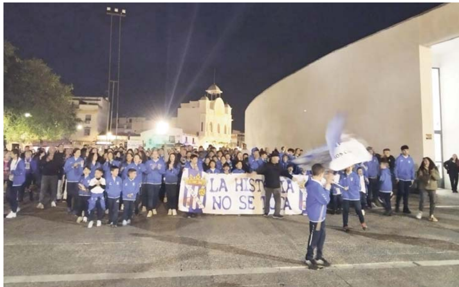
Imagen de la manifestación en las puertas del Ayuntamiento de Camas.