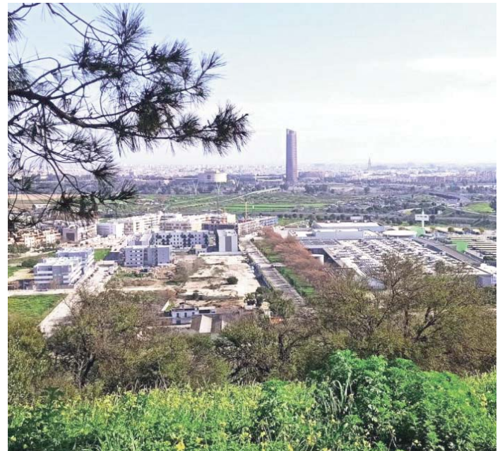
Vistas de Sevilla desde Camas.

Las condiciones impuestas por el Ayuntamiento de Camas incluyen también la necesidad de presentar “el certificado del director técnico del proyecto, en el que se acredite que la implantación de la actividad se ha realizado conforme al proyecto y anexos