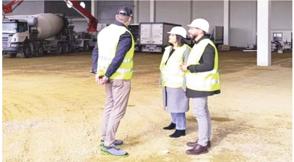
Visita del alcalde de Camas.

Este nuevo centro supondrá un impulso significativo para la economía local, no solo por el volumen de inversión, sino también por la generación de empleo y el fortalecimiento del tejido empresarial del municipio. Bidafarma apuesta así por Camas como una localización clave para su expansión, consolidando la ciudad como un polo atractivo para la inversión y el desarrollo industrial.