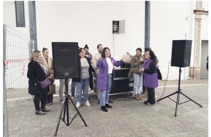
Lectura del manifiesto en Camas. VIVA

Como parte del compromiso institucional con la equidad de género, Camas recibió la visita de la Caravana por la Igualdad de la Diputación de Sevilla. La Casa Consistorial se convirtió por unas horas en el punto neurálgico de la lucha por una sociedad más justa e inclusiva, reforzando el trabajo que el Ayuntamiento realiza en favor de la igualdad de oportunidades.