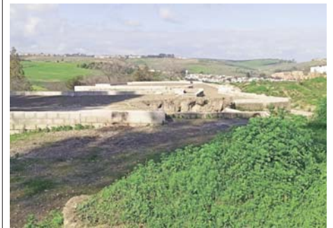
Yacimiento en el cerro del Carambolo. EUROPA PRESS

PLENO Su estado sigue generando críticas