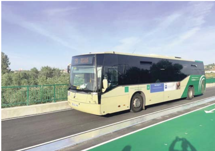
Puente de la Señorita en Camas.

La proyección es que este carril acoga cada día el tráfico de 1.985 vehículos privados