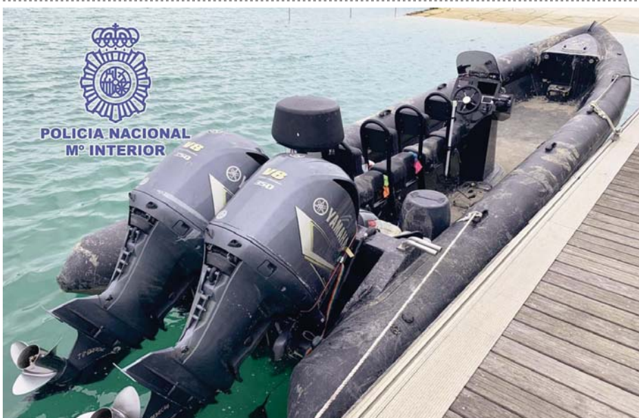
Imagen de una narcolancha en el Guadalquivir.