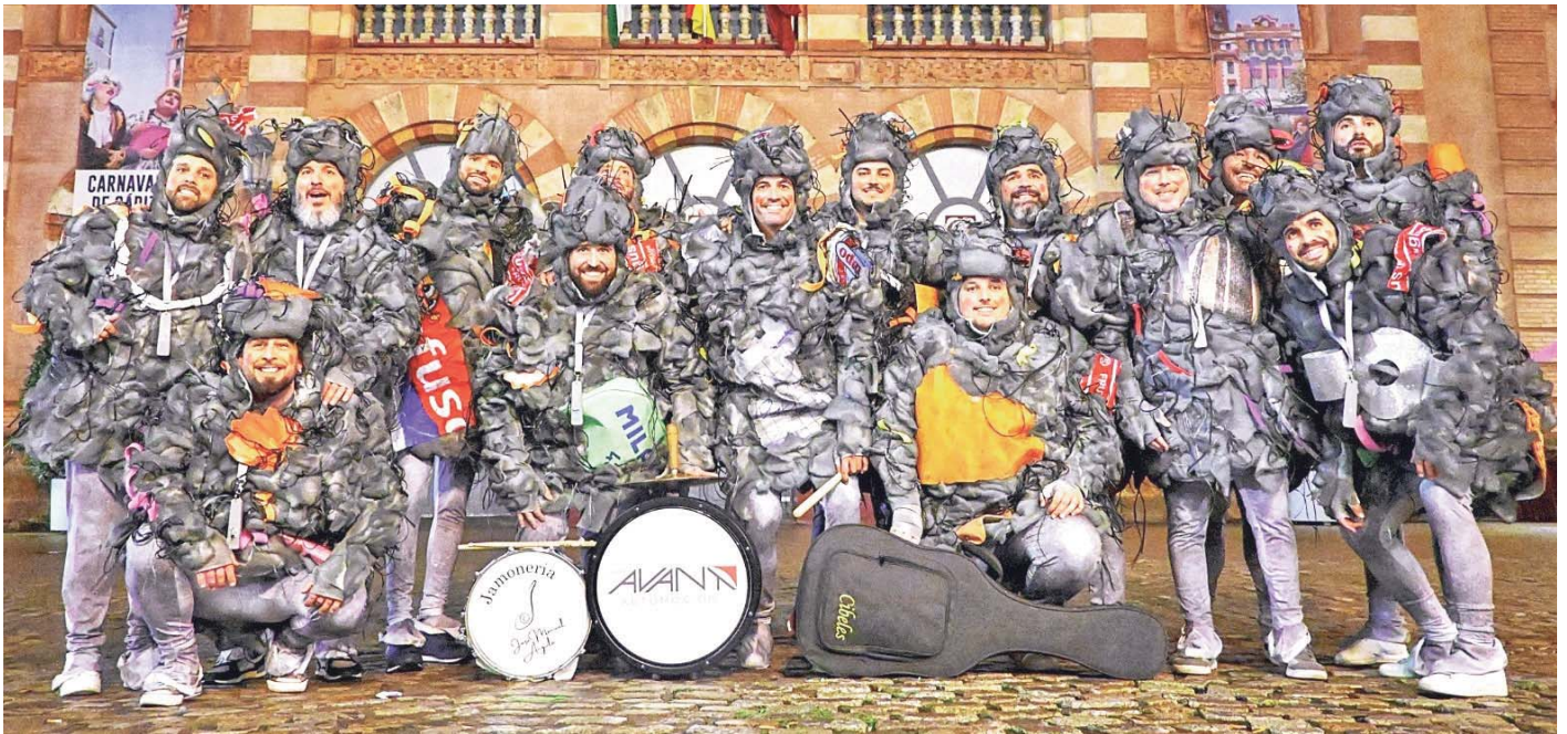
La chirigota camera "Cariño, qué pelusilla me tienes", en el Gran Teatro Falla. VIVA

ÉXITO EN CONCURSOS PROVINCIALES Han llegado a siete finales de ocho concurso a los que se han presentado y ganado en Dos Hermanas y Carmona ESFUERZO Y SACRIFICIO DEL GRUPO Compaginar la chirigota con la vida personal es difícil, muchos integrantes sacrifican tiempo con la familia y cambian turnos de trabajo