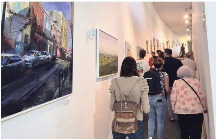
Exposición en la biblioteca de Camas. AYUNTAMIENTO DE CAMAS

El teatro también estará presente en la programación de marzo. El 14 de marzo, en el Salón de Actos del Ayuntamiento, se podrá disfrutar de la obra "Enloquecidas", dirigida a un público adulto. La representación comenzará a las 20:30 horas, y la entrada será gratuita hasta completar