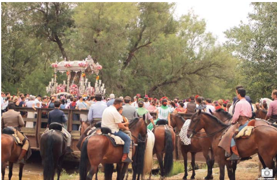
Peregrinación al Rocío de la Hermandad de Camas.