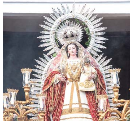
Nuestra Señora de la Candelaria. HERMANDAD