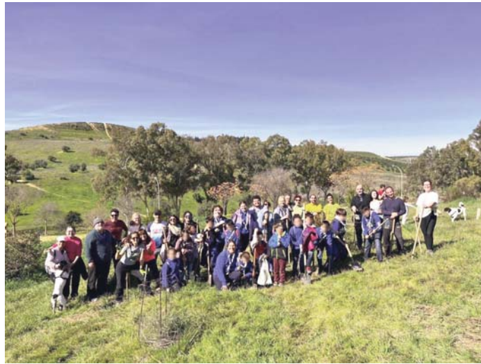
Reforestación en Camas. ASOCIACIÓN ARBA

boración del Ayuntamiento de Camas y la participación de otros colectivos como Colinas de Camas. Entre los asistentes destacó la presencia de un grupo scout de Espartinas, formado por unos quince niños acompañados de sus monitores, quienes se encargaron de plantar las especies más pequeñas, mientras que las plantas de mayor tamaño