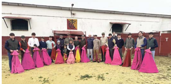
Escuela Taurina de Camas. VIVA