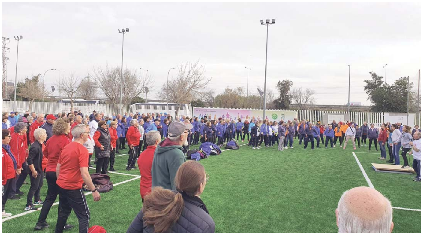
Primer Día del Corazón en Camas.