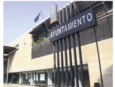
Ayuntamiento de Camas.