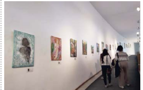
Exposición en Camas.