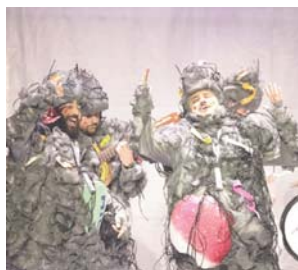
"Cariño, qué pelusilla me tienes", en el Gran Teatro Falla. VIVA

y ahora que vamos para los cuarenta cuesta más. La familia disfruta el doble con nosotros", confiesa.