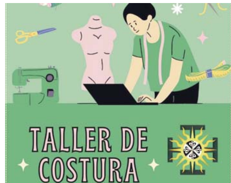
Taller de costura. HDAD SANTA CRUZ

lugar el próximo sábado 15 de marzo en la Casa Hermandad. La primera convocatoria está fijada para las 17:00 horas y la segunda para las 17:30. Durante la sesión ordinaria, se abordarán la lectura y aprobación del acta anterior, la memoria informativa de cultos y actividades de 2024, el balance de cuentas del pasado ejercicio y el presupuesto para 2025, así como el informe de la Hermana Mayor de Santa Cruz.