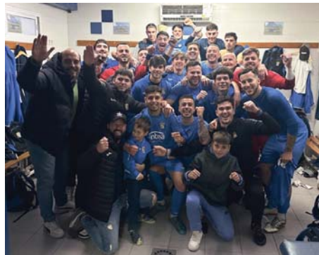
Camas CF. CFC

Con esta declaración, el club espera poder gestionar el estadio mediante una cesión de uso, lo que facilitaría su organización y planificación deportiva. “Tener este estadio en cesión de uso es algo muy bueno para nosotros. No tendremos que pedir hora, aunque colaboraremos con los colegios y las escuelas municipales, con quien haga