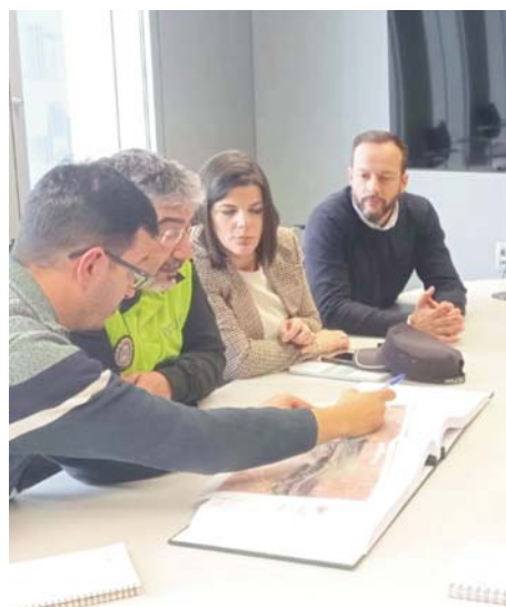
Imagen de la reunión.