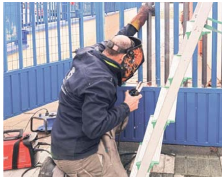
Operario del Ayuntamiento. AYTO BORMUJOS

Con esta nueva intervención, el Ayuntamiento sigue avanzando en su compromiso de mejorar las infraestructuras educativas de los centros de Bormujos. La instalación de esta nueva puerta forma parte de una serie de mejoras necesarias que se están realizando en los colegios de todo el municipio.