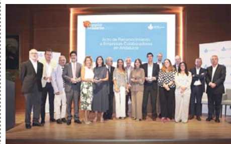
Hospital San Juan de Dios. HS.IDA

San Juan de Dios también ha reforzado su apuesta por la sostenibilidad, implementando innovaciones como la instalación de paneles solares en sus centros, para generar energía solidaria que beneficie directamente a pa-