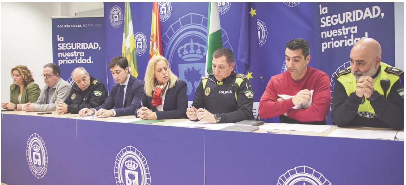
Acuerdo del Ayuntamiento de Bormujos con la Policía Local. AYUNTAMIENTO DE BORMUJOS

MÁS PATRULLAS Se refuerza la presencia en las calles, pasando de tres a cinco agentes por turno