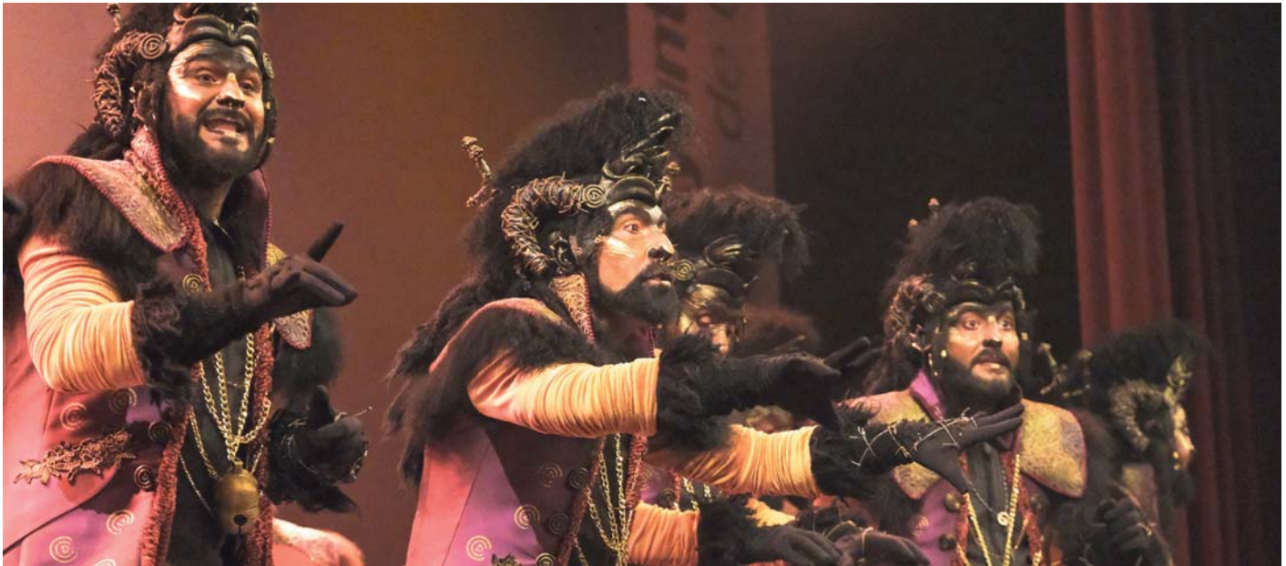
Imagen del Carnaval de Cádiz del año pasado.