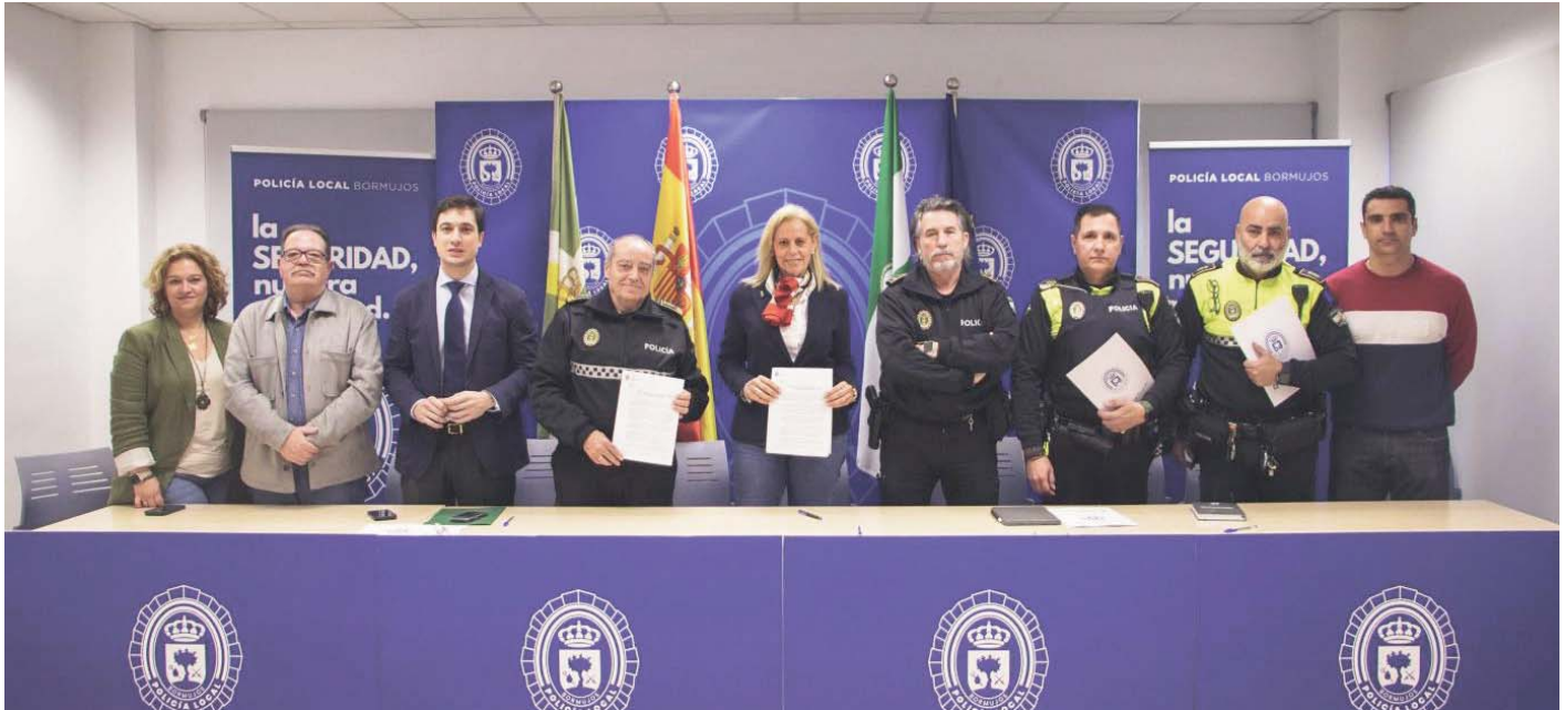
Acuerdo con la Policía Local. AYUNTAMIENTO DE BORMUJOS

ACUERDO El pacto, alcanzado tras un año de negociaciones, mejora las condiciones laborales de los agentes y refuerza la presencia policial