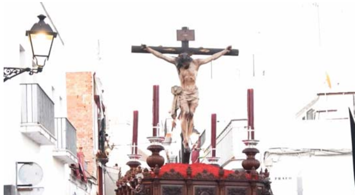
Hermandad Sacramental de Bormujos. HDAD SACRAMENTAL

MÚSICA COFRADE El evento, con entrada libre, se celebrará el 29 de marzo en la Plaza de la Iglesia de Nuestra Señora de la Encarnación