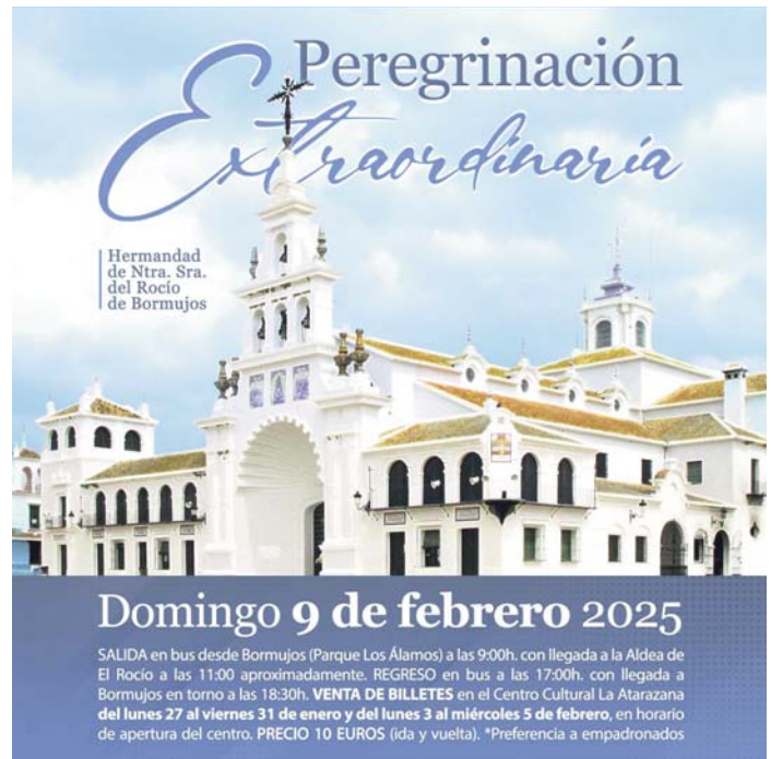
Peregrinación al Rocío.

Esta actividad pretende facilitar el acceso a una de las tradiciones más queridas del municipio, brindando a los vecinos la oportunidad de participar en una experiencia junto a la Hermandad del Rocío de Bormujos.