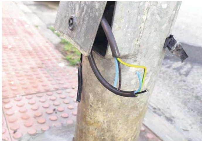
Desperfectos en Bormujos.

En respuesta a los últimos actos de vandalismo y sabotaje que han afectado el sistema de alumbrado público en Bormujos, la Policía Local procedió a instruir las diligencias correspondientes, las cuales han sido enviadas a la autoridad judicial. Este tipo de delitos, que atentan contra el patrimonio público y la seguridad del resto de ciudadanos, han generado gran preocupación en la localidad. La