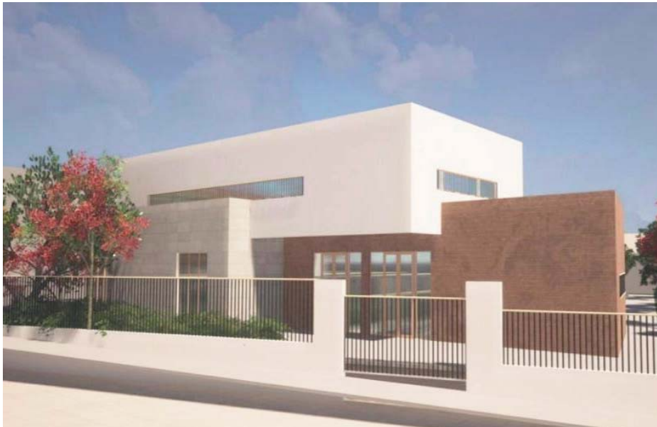
Imagen del proyecto. AYTO DE BORMUJOS

Este ambicioso proyecto se encuentra ubicado en la Calle Conde de Barcelona, 6, haciendo esquina con las calles Corral del Pequeño y Juan