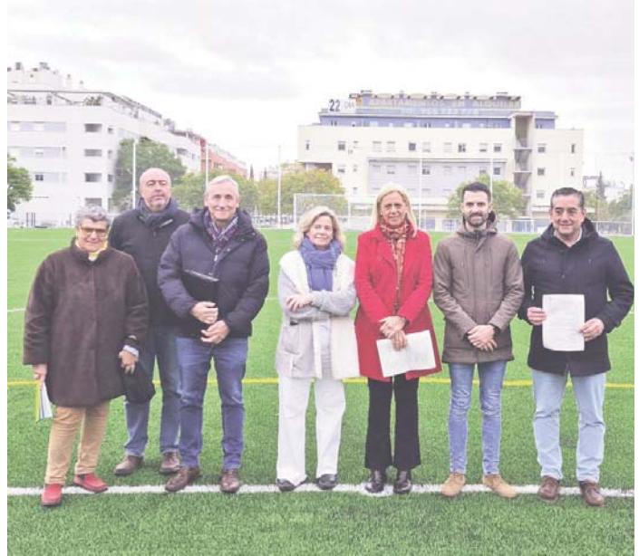
Nuevo campo de fútbol de Bormujos. AYUNTAMIENTO DE BORMUJOS

En total, la inversión en el nuevo campo de fútbol superará los 600.000 euros una vez que la obra esté completamente finalizada. Lola Rome-