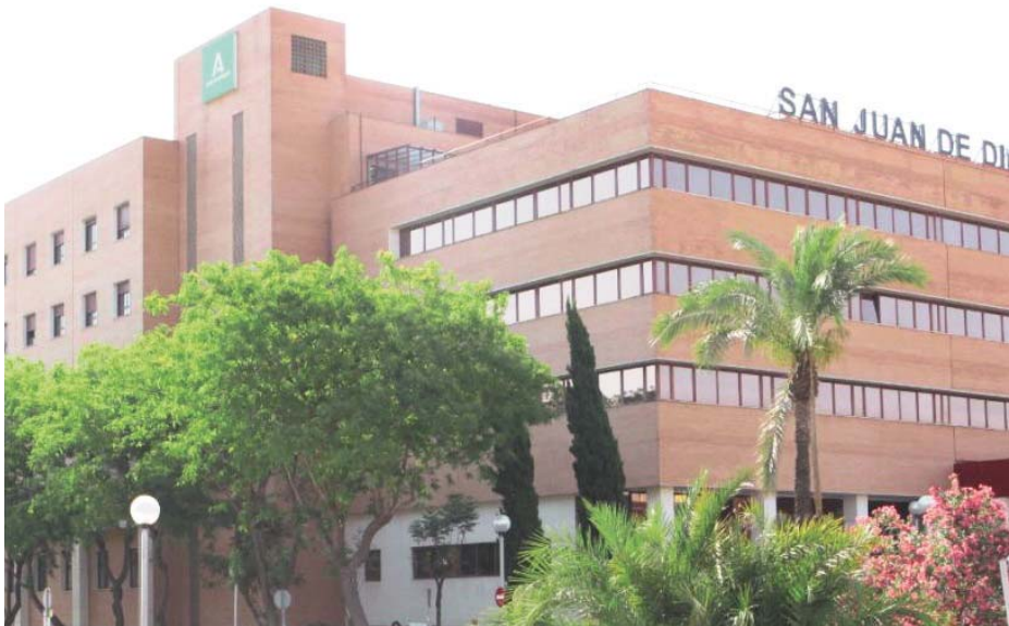
Fachada del Hospital San Juan de Dios del Aljarafe. HS.IDA

La resolución, notificada durante el pasado mes de enero por la Agencia de Calidad Sanitaria de Andalucía, confirma que el hospital de Bormujos sigue ajustando su funcionamiento a criterios de calidad que abarcan aspectos clave como la organización de la actividad, la accesibilidad de los servicios, la continuidad de la atención, los derechos de los usuarios y la seguridad de los procesos. Este logro fue validado tras la visita de seguimiento realizada el pasado 15 de enero, en la que se comprobó que el hospital continúa cumpliendo todos los requisitos establecidos para el nivel “Óptimo”.