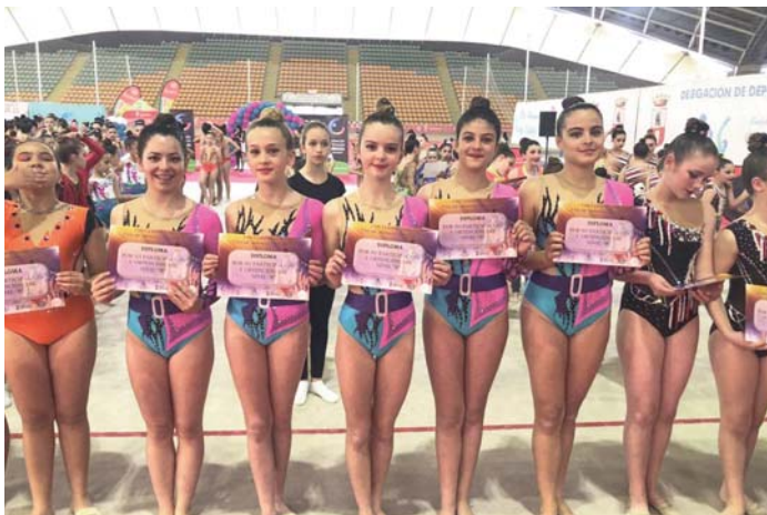
JD Bormujos. VIVA

En el club JD Bormujos, los resultados han sido sobresalientes esta temporada. En la final del Campeonato de Andalucía, consiguieron el subcampeonato en la categoría infantil B, además de diplomas para las ocho primeras clasificadas en las categorías juvenil, cadete y benjamín. En la primera fase de Prom-