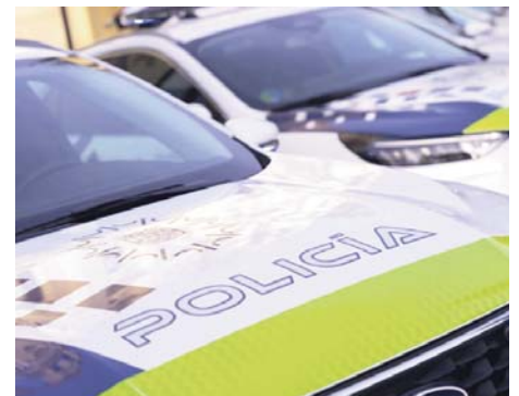
Coches de la Policía Local. POLICIA LOCAL

Desde la Policía se agradeció la intervención de todos los servicios implicados en la gestión del incidente y se hizo un llamado a la ciudadanía para que extreme la precaución. Aunque en este caso no hubo víctimas, se recordó la importancia de conducir con responsabilidad.